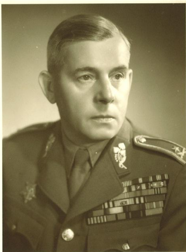
(Brig. gen. Karel Paleček 1896 – 1962)

Od 15. 5. 1945 již působí na MNO v Praze, jako zástupce přednostu 2. oddělení HŠ – pplk. just. JUDr. A. Rašlu. (F. Moravec je „odstaven“ na neomezené dovolené, od 1. 12. 1947 do 28. 2. 1948 velitel 14. divize v Mladé Boleslavi). 24. 5. 1945 se Palečkovi hlásí např. Viliam Gerik (ZINC). Paleček vytváří na ministerstvu „Likvidační skupinu“, která pátrá po