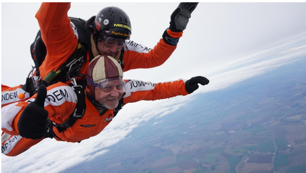
(L. Sliva, tandem Prostějov 2017)

vojáků za nekázeň a špatnou ochranu základny. Vyhrožování prokurátorem, nasazení metody cukru a biče, uklidnění situace, změna jednání na přátelský až otcovský přístup, povídání si o vojenské službě a úkolech (ve skutečnosti vytěžování a získávání informací) a opuštění základny. Rychle, ještě v lese sepsat vše co si pamatujeme, jména vojáků a úkoly skupiny, zakreslit do mapy... Doufal jsem, že si ti vojáci uvědomili, že za války by již byli asi mrtví. Věděli jsme vše, co jsme potřebovali. Zpátky k vrtulníku a můžeme letět za velitelem... Při dokladu o splnění úkolu nám pplk. K nechtěl věřit, že jsme základnu našli a dokonce na ní vstoupili. A když jsme předložili vše, co jsme zjistili – rezignoval. „To já nemůžu veliteli brigády říct, ten je zabije“. To už je vaše věc veliteli, my jsme úkol splnili.“ Nevím, zda informoval velitele brigády, ale myslím, že ne. Jen vím, že zamířil k veliteli roty... Já myslím, že to stačí.