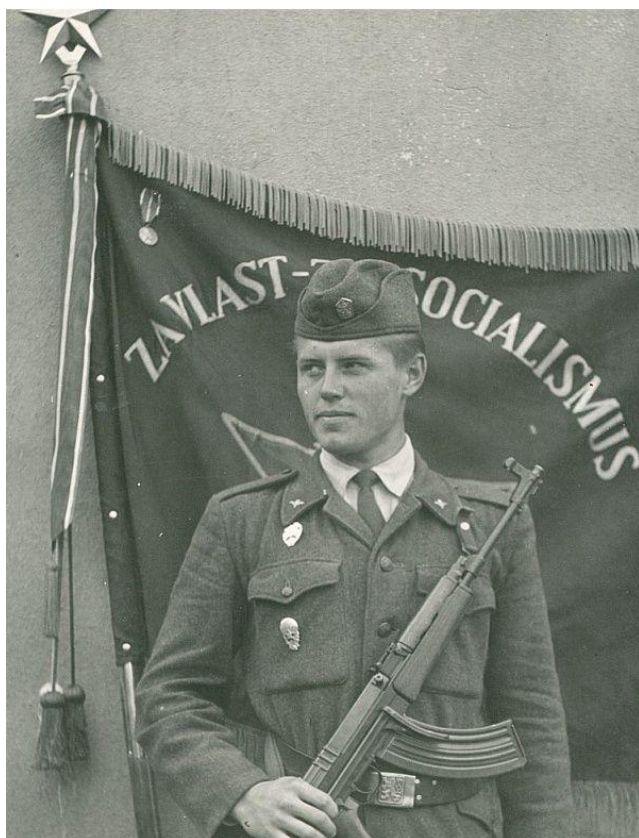
(J. Fencel – foto u bojové zástavy pluku)

Narukoval jsem k 65. výsadkovému praporu do Holešova. Po příjezdu byli vybráni všichni, kdo „dělali“ zápas, box nebo judo a odveleni k ženijní četě. U výsadkářů ženisti nestavěli žádné mosty, ale pracovali výhradně s trhavinami. To mě bavilo a práce s trhavinami mě nadále provázela celý život. Když přišel požadavek poslat někoho na potápěčský výcvik, aby se mohli provádět trhací práce i pod vodou, vůbec jsem nezaváhal a