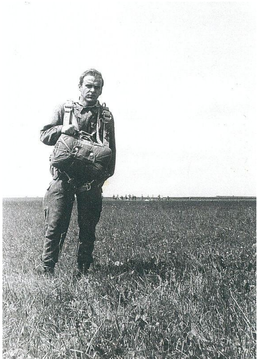
(Sám parašutista v poli...)

Po vojně jsem nějaký čas skákal v Plzni na Borech, ale pomalu jsem tlumil své aktivity, až jsem totálně zamrzl a věnoval se, tak jako většina mých kamarádů – desantů, práci a rodině. Ale červený baret je na čestném místě ve skříni, paraplacka v šuplíku, fotky v krabici a nádherné vzpomínky na dobu, kdy jsme sice moc peněz neměli, ale byli jsme velice bohatí... Doma jsem byl trošku za cvoka, co vybíhá od oběda a sleduje Andulu, jak sype parašutisty. Ale kdo s kamarádem nebalil padák a nebaštil z jednoho ešusu, nepochopí. To se léty změnilo. Osvícení mužové