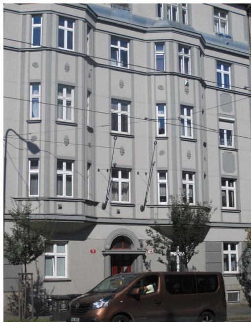
Klatovská tř. č. 78

motostřelecké divize (VÚ 5937 Plzeň) 1. armády (VÚ 6383 Příbram) a asi 40 různých vojenských útvarů, všeobecně děleny na Bory a Slovany. V kraji byly výsadkové jednotky - roty hloubkového průzkumu (RHPz) od 19. msd - 19. pzpr (VÚ 4436 Tachov), a od 2. msd - 2. pzpr (VÚ 1056 Janovice nad Úhlavou). 2. msd - VÚ 2493 byla dislokována v Sušici. (Historie 2. pzpr – viz internet – vu1056jnu.webnode.cz) . Pzpr vznikly v roce 1966 reorganizací z původních pzr a existovaly do roku 1992, kdy byly postupně zrušeny. V rámci ČSLA bylo celkem 10 pzpr, u každé divize jeden. Poddůstojnická škola (PŠ) byla u 14. pzpr (VÚ 6158 Prešov), ŠDZ u 3. pzpr (VÚ 9700 Kroměříž). Dnes existenci útvarů připomínají torza zaniklých bývalých kasáren. Nejbližší vojenské jednotky od Plzně jsou dnes v Klatovech (142. pro – VÚ 8132), Rakovníku (45. mpr), Žatci (4. mb) Strakonících (25. plrp). Plzeň a okolí je bohaté na historii vojenských výsadkářů. V Plzni a okolí se narodilo, navštěvovalo školy, sloužilo asi 8 výsadkářů londýnské sekce D (Potůček, Krátký, Niemczyk, Žižka, Horák, Hanina, Weyrich, Nocar – viz příloha A).