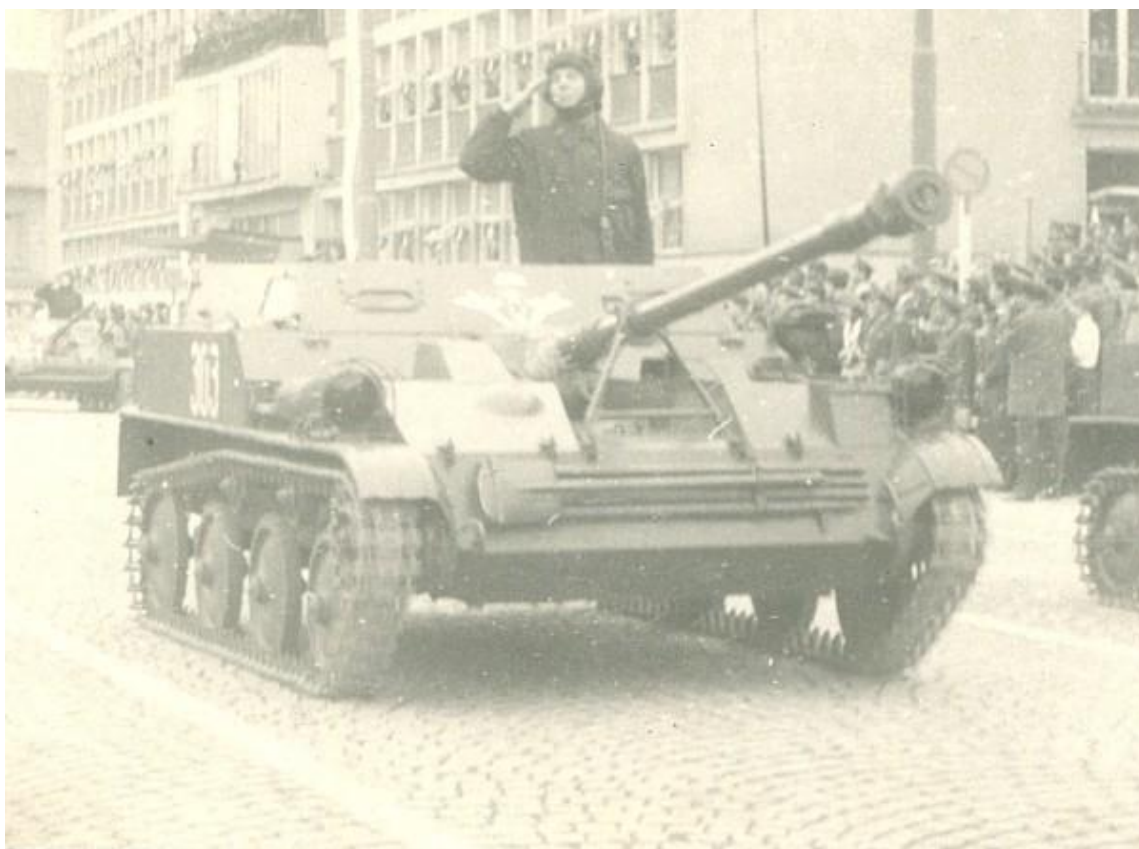
(Voj. přehlídka – K. Fanta, ASU - 57)