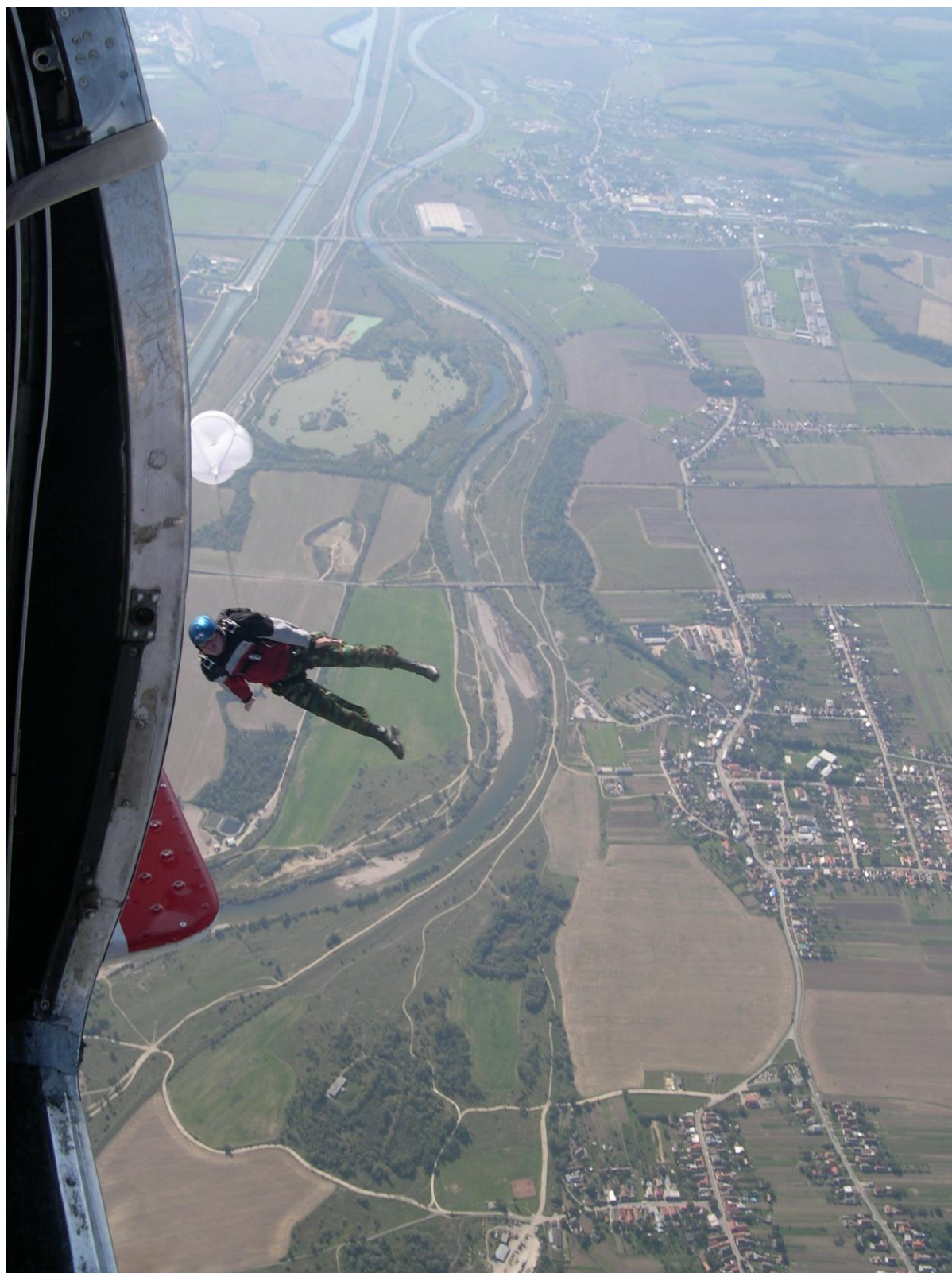
(Když to „odfoukne“. Slávnica 2006, L - 410, zádržka, 2000 m, vlevo úplně nahoře Vážský kanál, dálnice D-1 Bratislava – Žilina, řeka Váh )