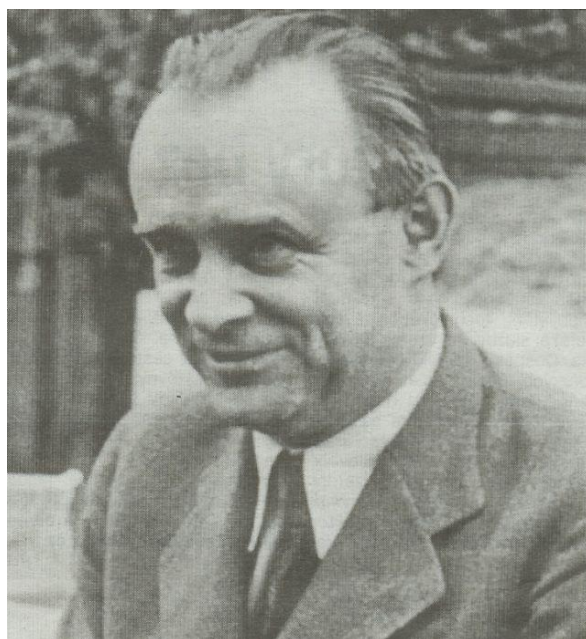
(Brig. gen. Fr. Moravec 1895 – 1966)