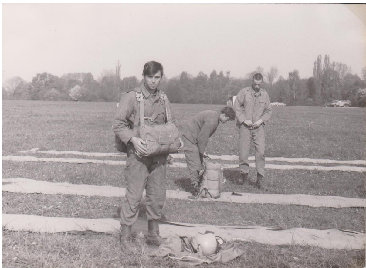
(Základní výcvik, Vyškov 1973, klika na ZVP ještě na pravé straně)