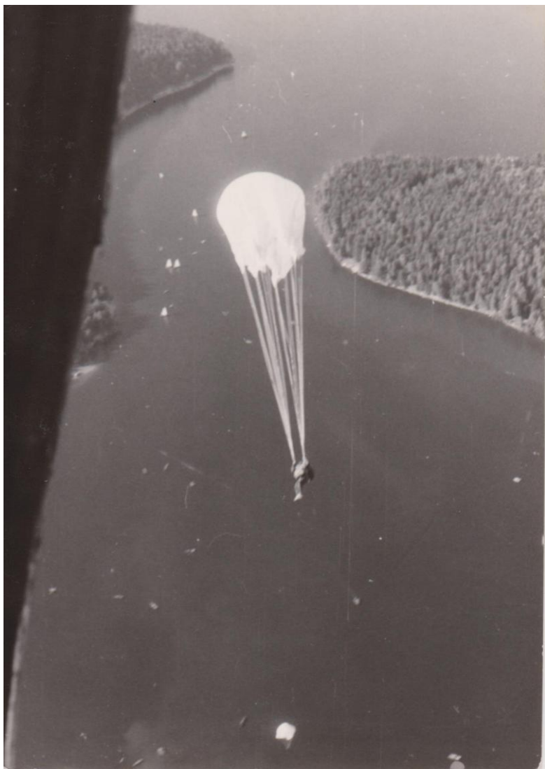
(J. Havránek – An – 2, vodní plocha Seč – Chrudim, hloubka cca 35 m)

Z působení u 19. pzpr bych rád vzpomenul několik skutečností, které se váží k výsadkařině. V průběhu odborného výcviku jsme u rhpz naprosto pravidelně prováděli seskoky a to jak v posádce z Mi 4, ale také každoročně při týdenním soustředění na letišti Plzeň Bory, kde jsme stanovali. Seskoky se prováděli opět z Mi 4, AN 2 (z Prostějova), IL 14 (z Mošnova) a také při každoročním 3 týdenním soustředění všech RHPz 1. A v Chrudimi. Prováděny byly všechny druhy seskoků a u voj. z pov. i do přehrady. Mezi významné úkoly 19. pzpr patřil tzv. komplexní průzkum státní hranice, spočívající v otevřeném i utajovaném pozorování aktivit druhé strany a seznámení