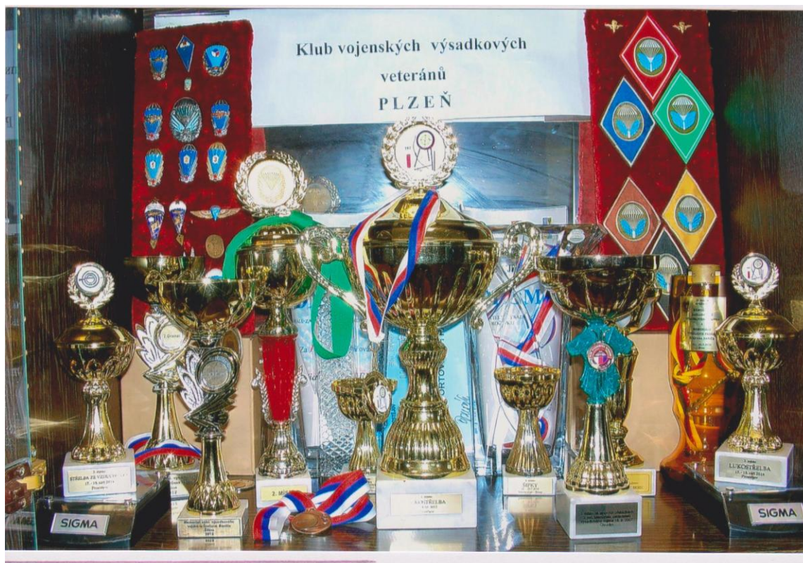
(Trofeje získané KVVV Plzeň)

Mimo výše uvedené organizujeme různé jednorázové akce, jako např. návštěvu filmu „Anthropoid“, besedu s účastníkem války v Iráku, ukázky práce Vojenské policie a Policie České republiky (sebeobrana, zákrok, použití psa), návštěvu vojenského útvaru, setkání s expertem na zbraně a střelby ze zajímavých zbraní, návštěva muzea VÚ 8280 atd. Snažíme se zúčastňovat i akcí jiných klubů.