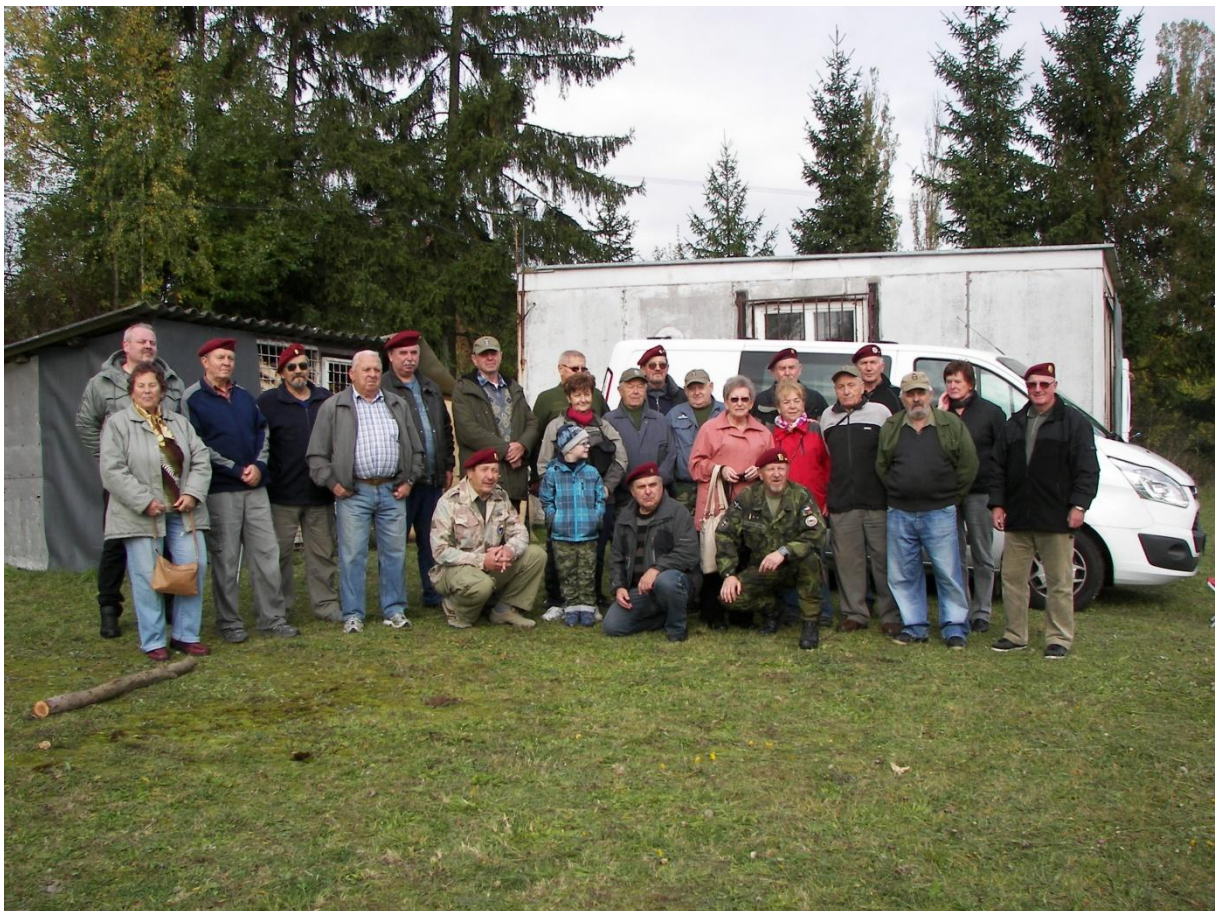
(KVVV Plzeň – Chotíkov 11. 10. 2017)

Máme svůj klubový odznak i domovenku. Uniformu představuje: tmavě modré jednořadové sako, světle modrá košile, šedé kalhoty, modrá kravata, černé boty a červený baret. Červený baret smí nosit pouze ten, kdo prokazatelně uskutečnil nejméně jeden samostatný seskok.