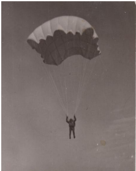
(K. Fanta – padák PD – 47)