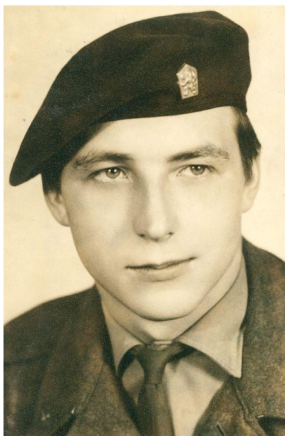
(„Základák“ K. Fanta)

5. 11. 1966 jsme složili přísahu a tím pádem jsme byli zařazováni do služeb: pomocník dozorčího roty, služba v kuchyni, služba na bráně, vyvaděč vězňů, stráž u zástavy, střežení muničního skladu, stráž na letišti a v autoparku, atd. Každý rok jsme absolvovali zimní a letní cvičení ve VVP Libavá. Zde proběhli rotní a praporní střelby a ženijní výcvik práce s trhavinou. Samozřejmostí byly pěší přesuny na velké vzdálenosti, nácvik přežití v přírodě, nácvik přepadení objektů. V rámci seskoků v Bechyni jsme provedli i přepadení a vyřazení letiště z činnosti. Prapornímu cvičení s vysazením v prostoru Olomouc předcházela přesun po železnici na letiště Tri Duby. Také jsme zažili seskoky z AN-24, z letounu, který byl schopen vysadit 60 vojáků nebo GAZik s BzK. Kromě součinnosti s jinými složkami armády jsme pomáhali i jinde.