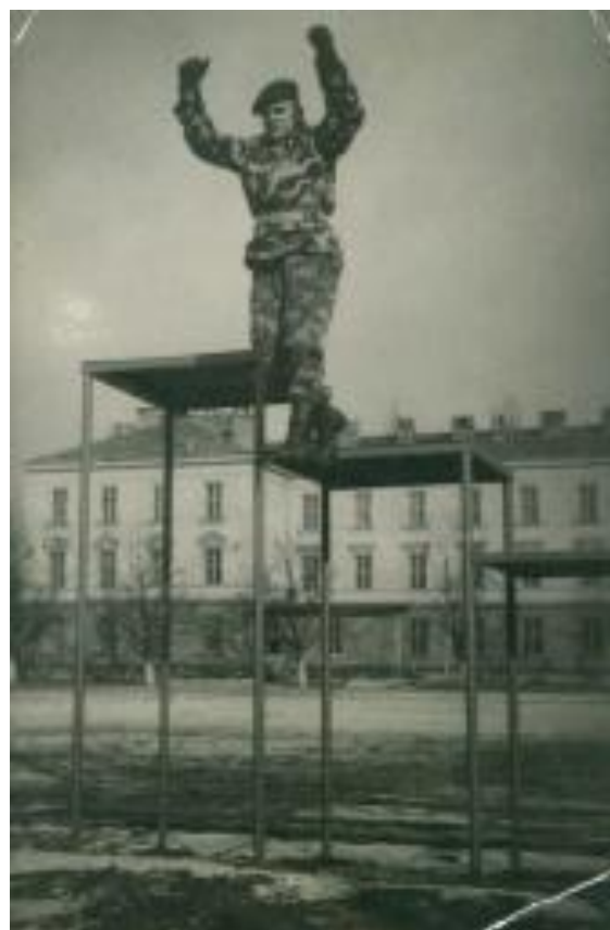
(Lávky, ŠDZ Kroměříž)

SDZ Kroměříž, to byla tvrdá, náročná zkušenost, krásné město (které jsme znali většinou jen ze společných vycházek v tvaru), přívětiví Moravané. A když už jsme se něco naučili, jelo se na výsadkové soustředění do Chrudimi. Hodně se skákalo z Anduly, IL-14 (ta s námi startovala z Pardubic), při zkouškách jsme bojové seskoky dělali v Holešově z IL-14. Dodnes obdivuji, jak nás flígři z dopravního pluku z Mošnova přesně vysypali na Libavé do cílového prostoru.