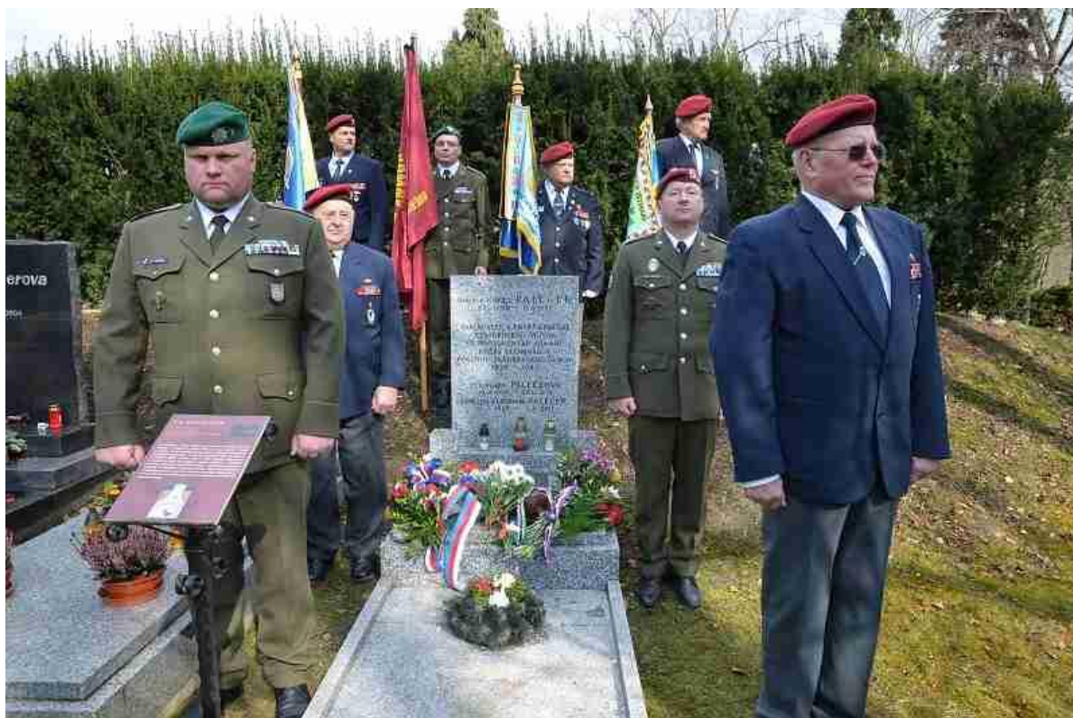
(Plzeň - pietní akt u hrobu gen. K. Palečka)

Pozn. Možný vzpomínkový okruh v Praze - „Po stopách K. Palečka“. „Domeček“ (Hradčany - Kapucínská ul.) – dům K. Palečka (Střešovice – ul. U první baterie 797/4) - dům P. Thümmela (Střešovice – ul. U třetí baterie 854/8) – činžák „parašutistů“ (Bubeneč – ul. Lotyšská 645/8).