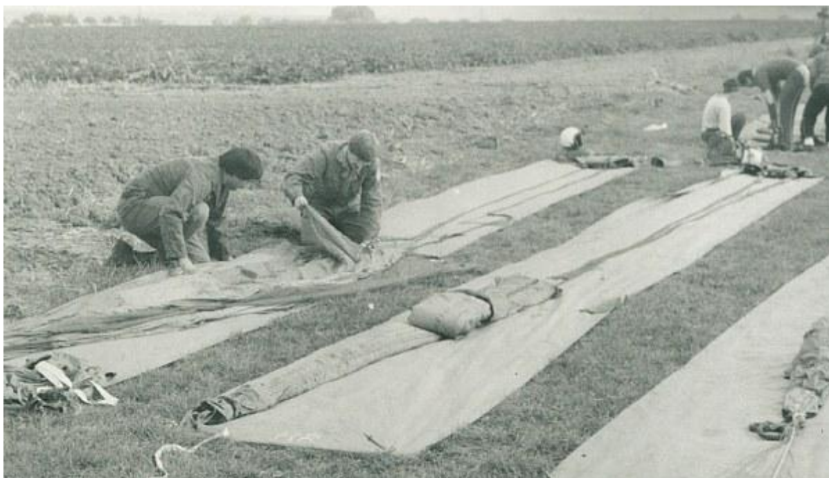
(L. Sliva – balení padáku OVP – 80)